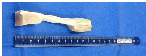
Figura 1: Aloinjerto HTH.

Todos los aloinjertos fueron obtenidos del banco de tejidos de nuestro hospital, siendo frescos y congelados, sin haber recibido ningún tratamiento químico ni radiante previo (fig. 1).